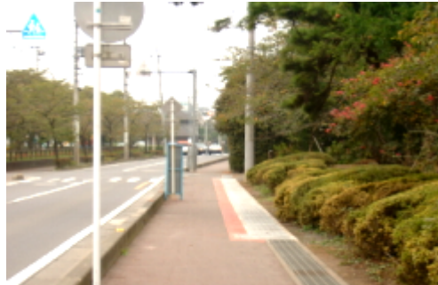
天覧山下にここ池前歩道の排水工事