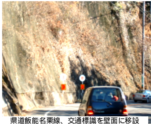
県道飯能名栗線、交通標識を壁面に移設