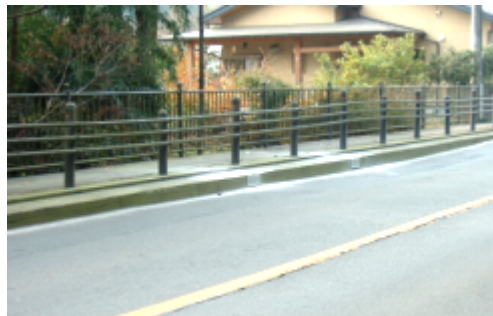
南高麗上畑の県道の排水工事05年11月