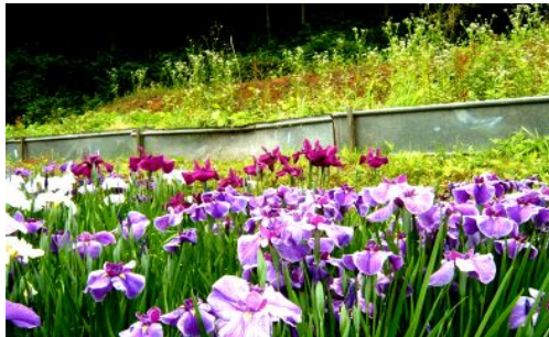
昨年6月ハイキングで撮影

国民を痛めつける政治がまかり通る中で、今年は、暮らし・福祉を守るために昨年に増してより一層がんばります。特に「生活相談所」を開設し、きめ細かな相談活動を行っていきます。今年も一所懸命がんばります。よろしく願いいたします。