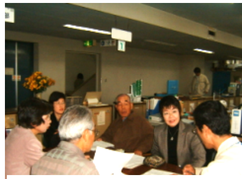
地域の人達と身近な要望を市に提出しました

子育て真っ最中のお母さん達と何度も何度も市と交渉して実現しましたさらに子育て世帯の負担軽減のためにがんばります。