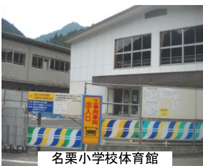
名栗小学校体育館

※平和市長会議とは、国連軍縮総会で広島市長・長崎両市長が世界各国の市長に「核兵器廃絶に向けての都市連帯推進計画」に賛同するよう呼びかけ、これに对应した世界各国の都市で構成された団体が、国連広報局NGOに登録されてきたものです。