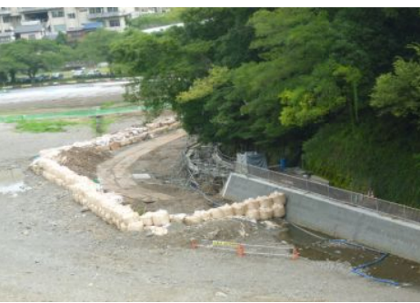
埼玉県がすすめる「水辺再生100プラン」の一つ、飯能河原

高萩市では、死亡1名、負傷9名、避難者約4800人、住宅全壊1棟、水道管の破裂など大震災で大きな被害を受けました。地震発生後まもなく救援物資の要請があり、その日の内に第一陣として食糧4500食、飯能水3600本、毛布などを搬送し、翌12日、第二陣として食糧3000食、毛布1000枚、給水袋2550袋、給水タンク2基を搬送。義援金を1000万円送りました。義援金はさらに各自治会や幅広い民間団体からも送られています。