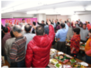
今年も団結頑張ろう！

1月16日、埼玉土建飯能口高支部は土建事務所まで2011年「旗びらき」を開催しました。