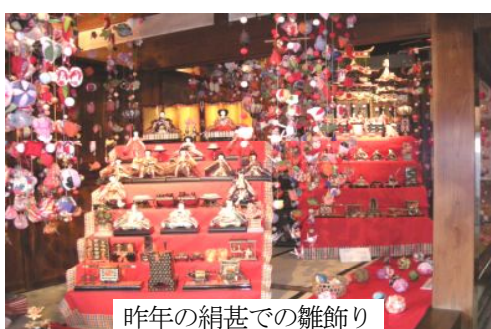
昨年の絹甚での雑飾り

しており、解散は時代の流れ。しようがない(文化新聞報道)という言葉に象徴されるように、自民党の消滅は「時代の流れ」になっているようです。