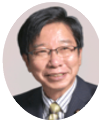
参院議員 大門みきし

昨年は北関東各地でお世話になり、大変ありがとうございました。自公政権を退場に追い込んだのは、まぎれもなく、国民の世論、運動と日本共産党の論戦でした。これからも政治を動かすのは、国民と日本共産党の共同の力です。