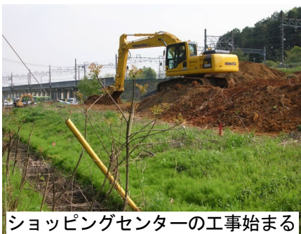
ショッピングセンターの工事始まる

男の子用も設置、男子トイレにはベビーカーチェアがあり、他にも多機能トイレとして障害者、高齢者、乳幼児に配慮したトイレとなっています。今後、阿須、中居、飯能川原も同様の機能を持つトイレが整備されます。