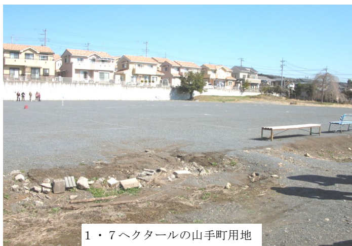
1・7ヘクタールの山手町用地

質疑の中で 市は、土地利 用審議会の設 置について、 市民会議に出 された意見を